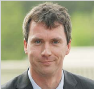
„Thermo-Service Europa ist zum festen Bestandteil unserer Leistungspalette geworden“

Im November letzten Jahres fiel der Startschuss bei CretschmarCargo Wuppertal für die frost- und hitzesicheren und auf Anfrage auch temperaturkonstanten Transporte in eine Vielzahl europäischer Länder. Nach nunmehr einem Jahr praktischer Erfahrung kann konstatiert werden: Das neue Angebot ist zum festen Bestandteil des CretschmarCargo Leistungsportfolios geworden und erfreut sich bei den Kunden steigender Nachfrage.