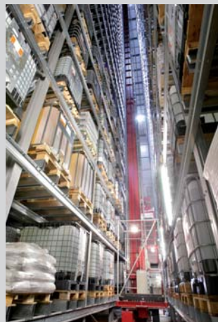
Modernste Technik: Brenntag Hochregallager