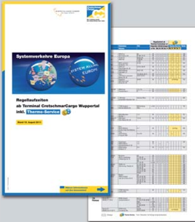
Perfekter Europa-Fahrplan für Stückgut- und Thermo-Service Transporte

gehen und wann sie in welchem Postleitbereich dort ankommen? Sie planen Thermo-Transporte nach Finnland und Portugal und möchten sich über Abfahrtstage und Laufzeiten informieren? Unser neuer Flyer „Regellaufzeiten für Systemverkehre Europa“ gibt Auskunft. In übersichtlicher Form, gegliedert nach Ziel-ländern, Zielstationen, Postleit-gebieten, Abfahrtstagen und Laufzeiten in Stunden finden Sie alle Planungshinweise, die Sie für europaweite Stückgut- und Thermo-Transporte benötigen. Der perfekte Fahrplan zu 57 Zielstationen in 32 europäischen Ländern, darunter allein 36 Zielstationen in 17 Ländern, die zusätzlich mit Thermo-Transporten ange-steuert werden.