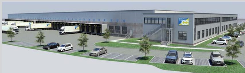
Computergrafik des im Bau befindlichen Speditionszentrums in Düsseldorf-Reisholz. 9.400 qm Hallenfläche, 89 Überladetore, umweltfreundliche Energieversorgung

geben. Alle Mitarbeiter der Niederlassung Wuppertal können nach Düsseldorf wechseln, die Arbeitsplätze bleiben erhalten, alle sind in Düsseldorf herzlich willkommen. Verhandlungen darüber, wie wir bei Umzügen und mit Fahrgeldern helfen können, wurden gerade abgeschlossen.