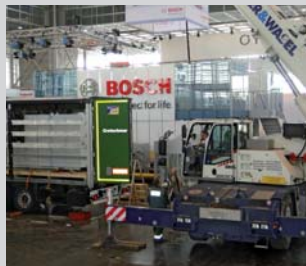
Die Messespezialisten von Cretschmar MesseCargo im tonnenschweren Einsatz: Standaufbau für Bosch auf der Interpack 2011, Düsseldorf

Norbert.Kuhnt@bosch.com www.bosch.de www.boschpackaging.com