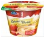
Emmi Griess Töpfli Rhabarber-Erdbeere