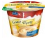
Emmi Griess Töpfli Classic