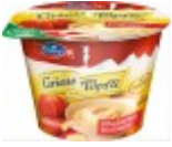
Emmi Griess Töpfli Rhabarber-Erdbeere