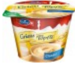
Emmi Griess Töpfli Classic