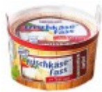
Eriskäse-Fass Meerrettich-Apfel Doppe...